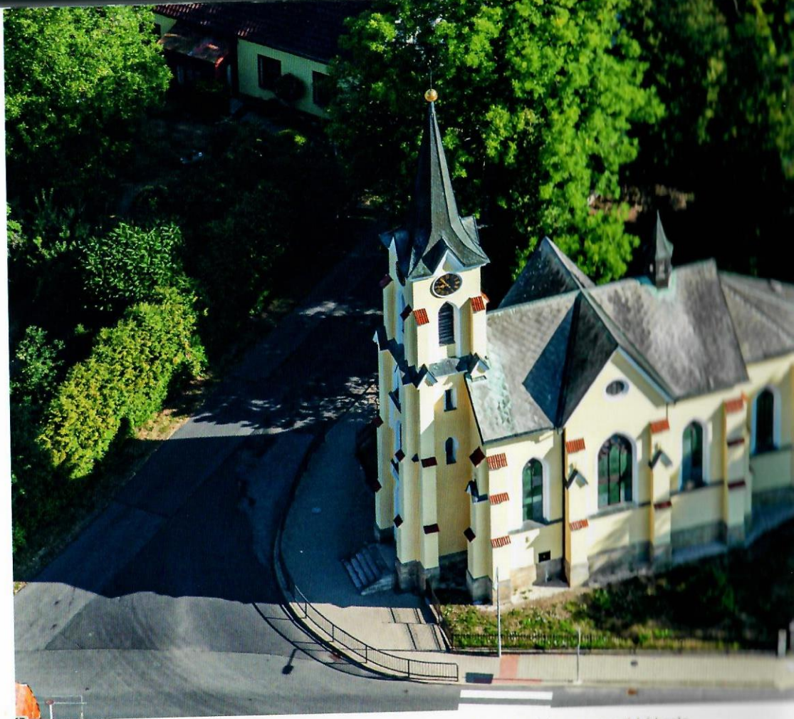
« Protáhlá podoba půdorysu Žďáru dokládá založení obce během kolonizace ve 14. století The elongated layout of Žďár documents that it was founded during colonisation in the fourteenth century Milan Paprčka | Matuš Krajňák 2018